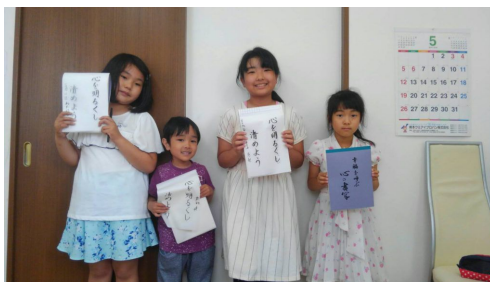
小学生たちの書写