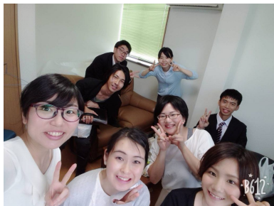
ダンスやスタッフで頑張った青年たち